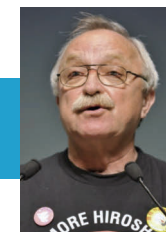
オレグ・ボドロフ