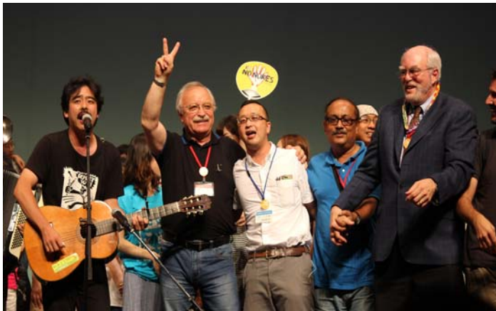
☆2016年原水爆禁止世界大会・広島大会 ファイナーレでの大合唱「We shall overcome」

感動胸に 大阪代表团 元気に帰国 六月二十日 ニューヨーク ク行動大阪 代表团が帰 国しました。 国連の傍聴 女性行進の 参加、署名宣 伝活動、平和 フォーラム 参加と精力 的に活動。