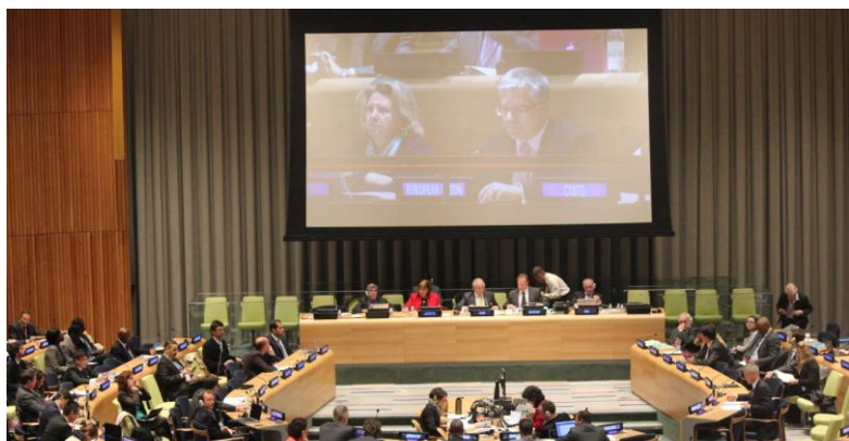
第三回準備委員会の議場