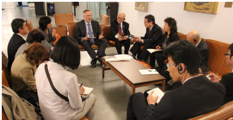
十三カ国代表部に要請活動