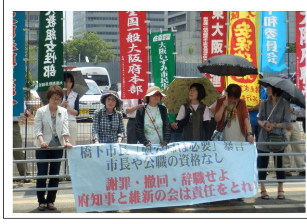
☆6月7日府庁前抗議行動