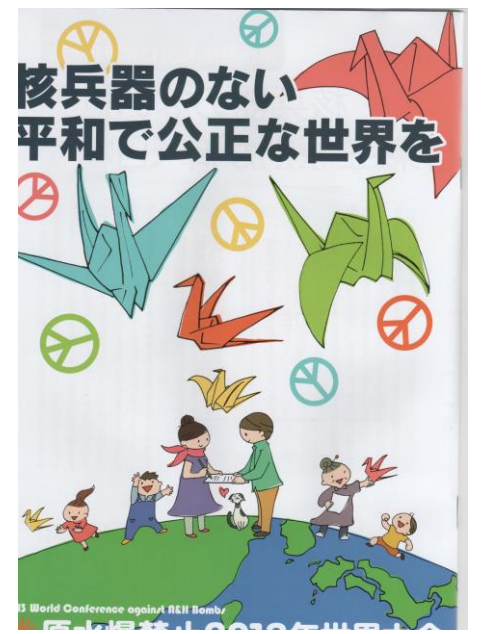
☆今年の世界大会パンフ

さんです。毎年、アメリカン大学の学生と立命館大学の学生と交流を続けてこられた方です。長崎大会に大阪から四百名以上の参加で成功させようと、各団体での取り組みが始まっています。