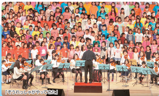
「ぞうれっしゃがやってきた」