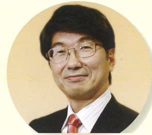
田上富久 長崎市長