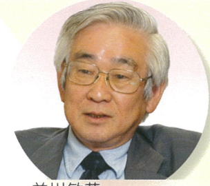
益川敏英 名古屋大学特別教授