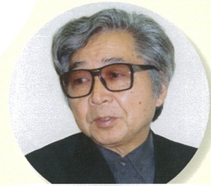
山田洋次 映画監督