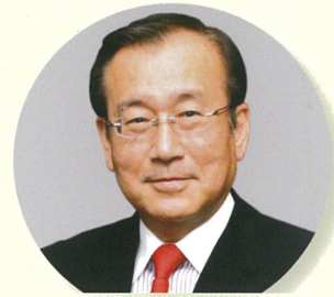
秋葉忠利 広島市長