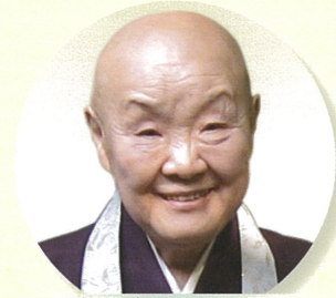
瀬戸内寂聴 作家・僧侶