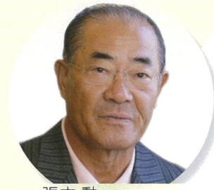
張本 勲 日本プロ野球名球会