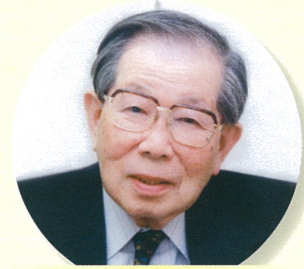
日野原重明 聖路加国際病院理事長